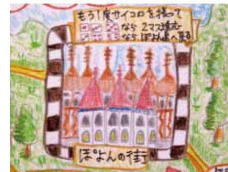
イベントマスの例

必ず止まらないといけないマス。出た目によって次に進むコースを決める 〇〇へ進む 〇〇へ戻る などコースの中で2~3ヶ所あると面白くなります。ここぞ、というマスに入れると良いでしょう。